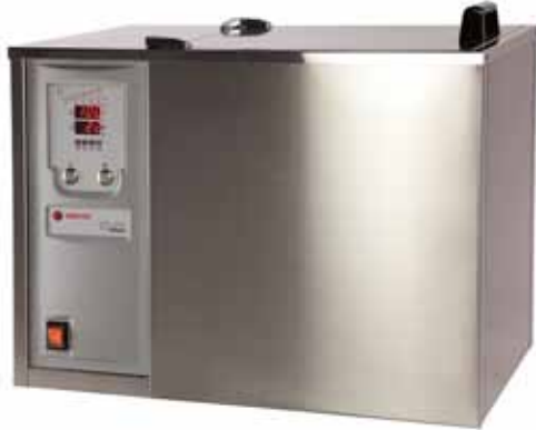
E2 - 080062 LAVEUSE ET POLYMERISEUSE

Le concept de contrôle manuel a été développé comme une alternative économique du Mestra standard avec contrôle électronique. La performance et les avantages répondent aux attentes de la plupart des utilisateurs et ce, à un prix des plus intéressants.