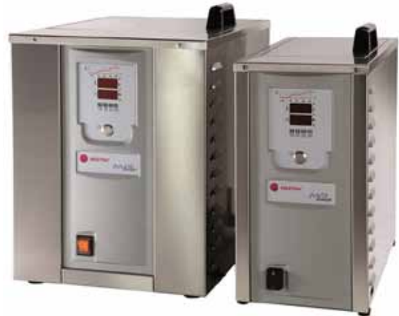
M18 - 080406 POLYMERISEUSE