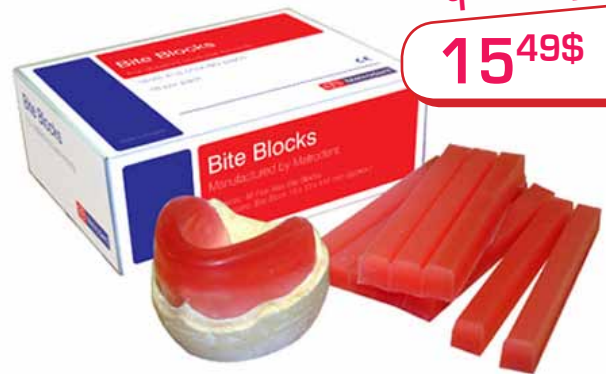
WAXBB48 (48 par boîte)