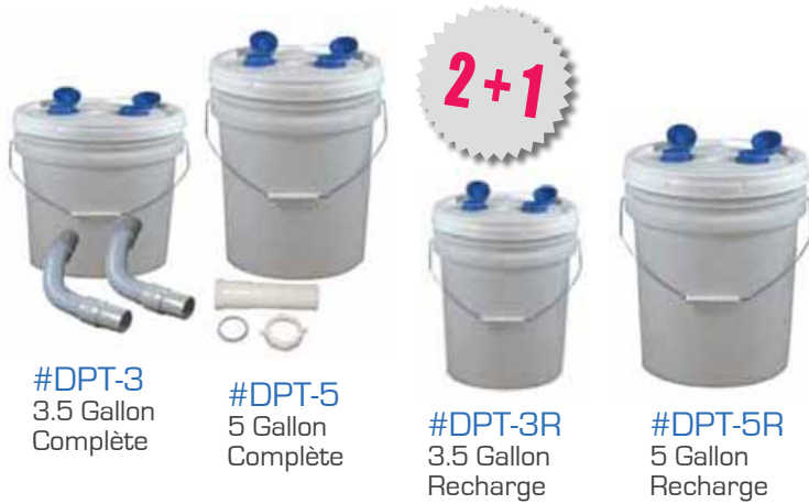
#DPT-3 3.5 Gallon Complète

Une alternative à la trappe à plâtre en métal. Sécuritaire, elle prévient le blocage du drain et les dépenses des travaux de plomberie. La trappe à plâtre disponible emprisonne le plâtre et autres matériaux plus lourds que l'eau. Facile à installer et à remplacer en quelques minutes.